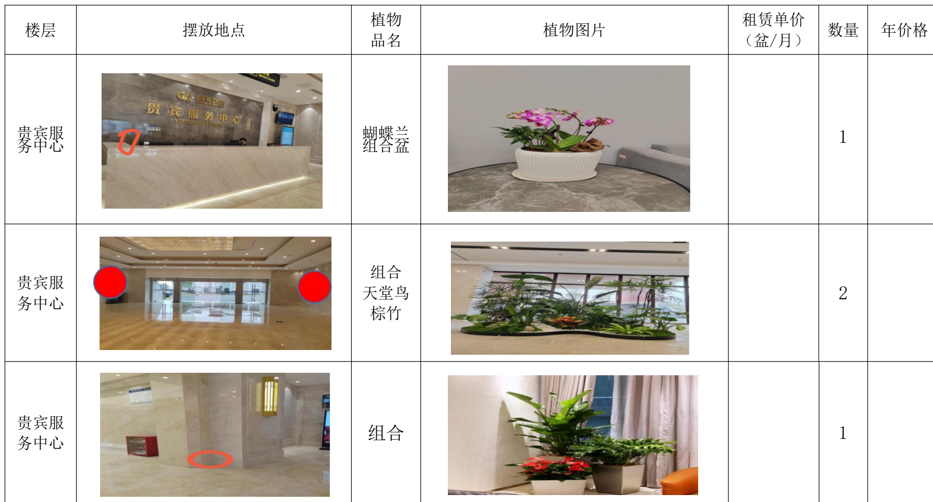
黔江机场绿化植物装饰参考图